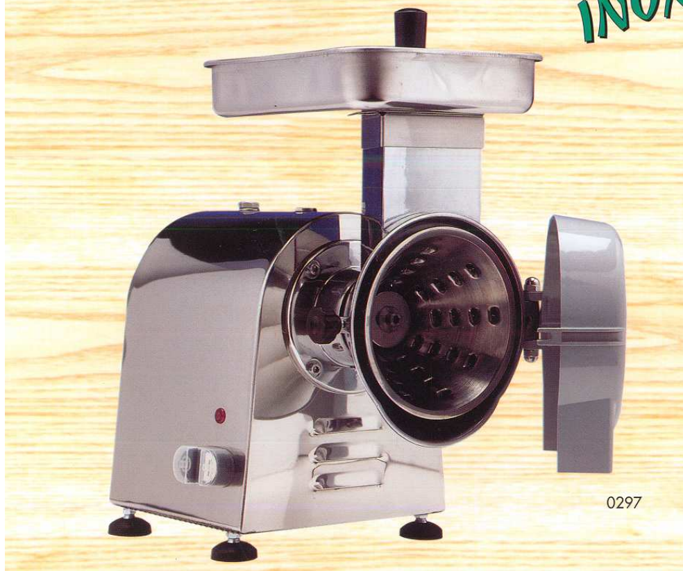
TAGLIA MOZZARELLA CARENATO IN ACCIAIO INOX